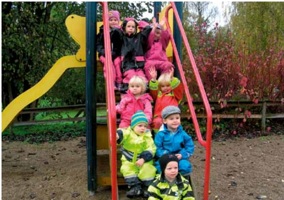
Läget är uppåt för Ringamåla förskola. För tillfället är 16 barn inskrivna.